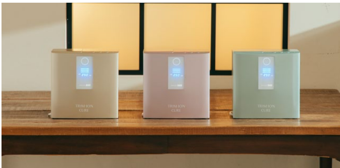
左からシャンパンゴールド（新色）、シルバーベージュ（2020年12月発売）、プラチナグリーン（新色）

そして、サイズも非常にコンパクトでシンクサイドにすっきりと置くことができます。初期カラーのシルバーベージュに加えて、「プラチナグリーン」「シャンパンゴールド」の登場で、自分だけのキッチン空間を作って楽しむことができます。