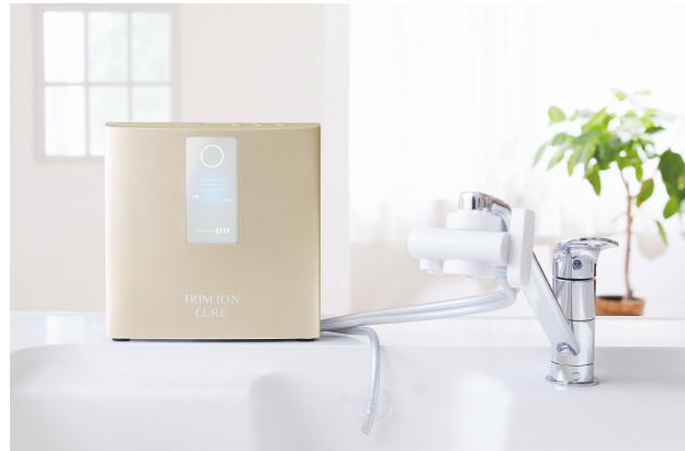
シャンパンゴールド