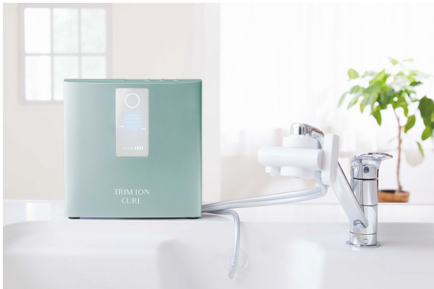
プラチナグリーン

整水器を製造販売している株式会社日本トリム（本社：大阪市、代表取締役社長：森澤紳勝）は、「連続生成型電解水素水整水器 TRIM ION CURE」の新色モデル「プラチナグリーン」「シャンパンゴールド」を、2021年7月15日より発売します。